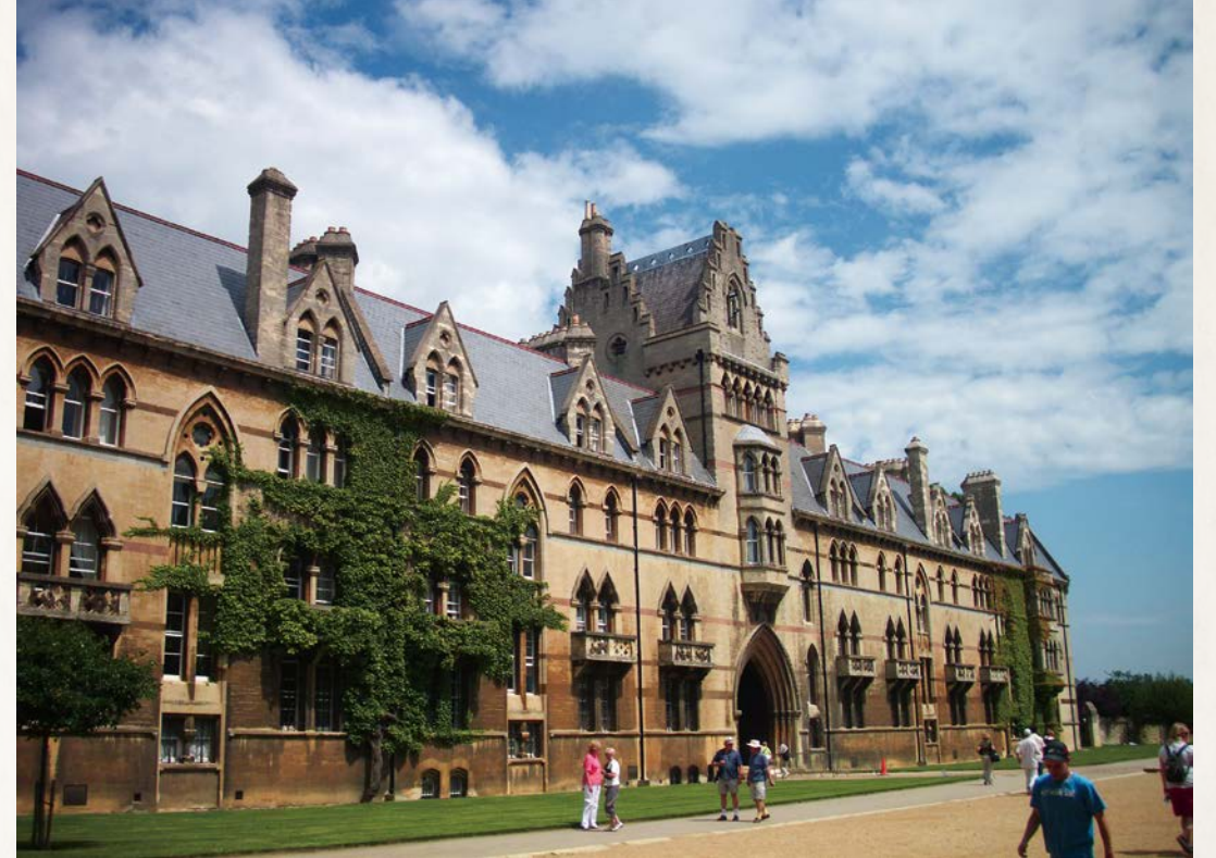
英國牛津大學的基督書院，威克里夫曾是牛津的學生和教授。

威克里夫認為，任何權柄都是來自上帝，但該權柄不可尋求自己的利益，而應當如基督所示範的，要服事受統治者，而非受人的服事。因此，他反對教權對政權的干涉，主張教會的財富是上帝託教會管理及使用的，教會並無所有權。如果聖職人員濫用財富，政府有權將之沒收，因為上帝派政府管理俗事。威克里夫認為，只有聖經是教會的法律，而不是教廷的種種規定。教會是全體受揀選的信眾，只有基督是教會元首，而不是教宗及樞機院。