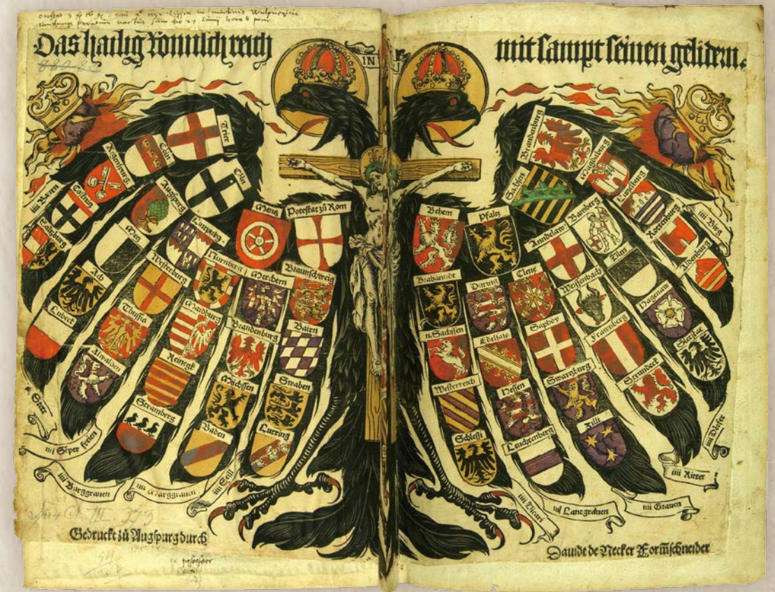
神聖羅馬帝國的國徽雙頭鷹，這幅圖像繪於 1510 年。大部分歐洲國徽的雙頭鷹，都是源自東羅馬帝國國徽的傳統。