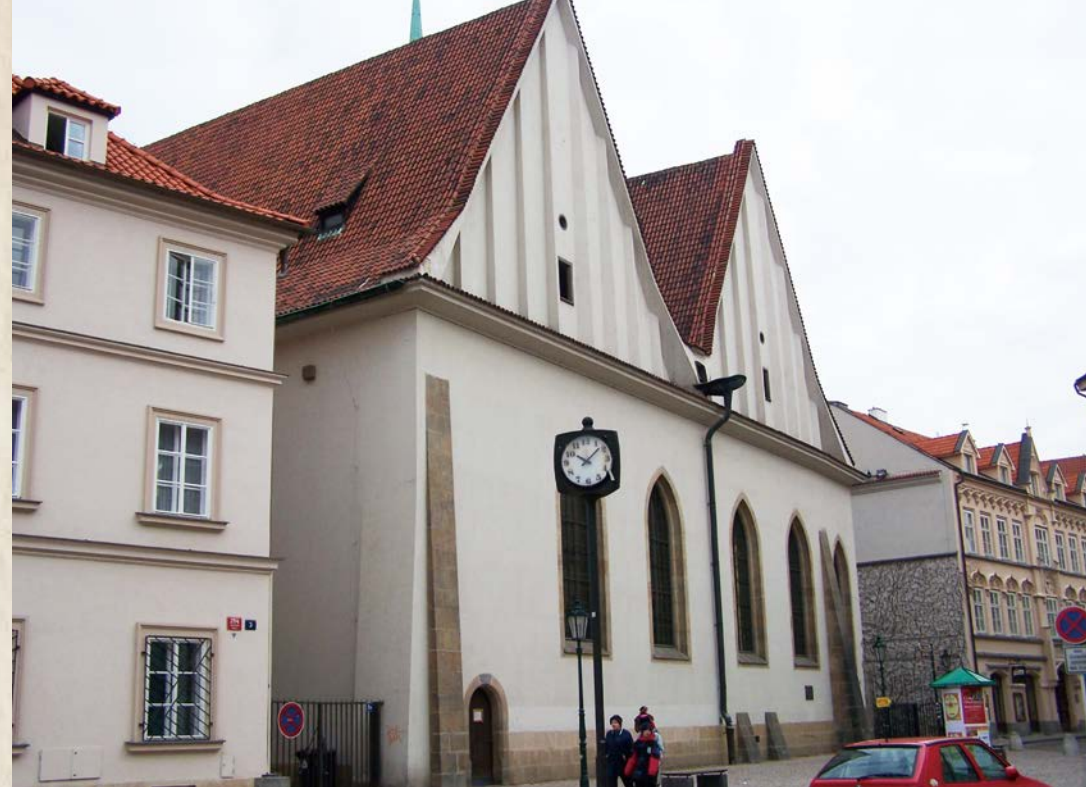
布拉格的伯利恆教堂，這是胡司在捷克事奉之處，向群眾宣講聖經的教導。

1409 年，約翰二十三世（John XXIII，卒於 1419，他於 1410 至 1415 年在位，由於歷史認為他是僭稱教宗，所以天主教史的「約翰二十三世」不是指他，而是指 20 世紀的一位教宗）將威克理夫的教訓定罪，把他的書焚燒，同時禁止胡司講道。可是，胡司按良心仍然講道，決定不順從教宗的命令。1410 年，教宗召胡司去羅馬應訊。由於胡司拒絕前往，教宗在 1411 年將胡司開除教籍。