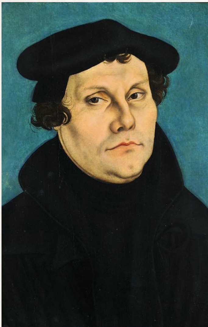
1528 年的馬丁路德，由老盧卡斯·克拉納赫繪畫，現藏科堡城堡 (Veste Coburg)。