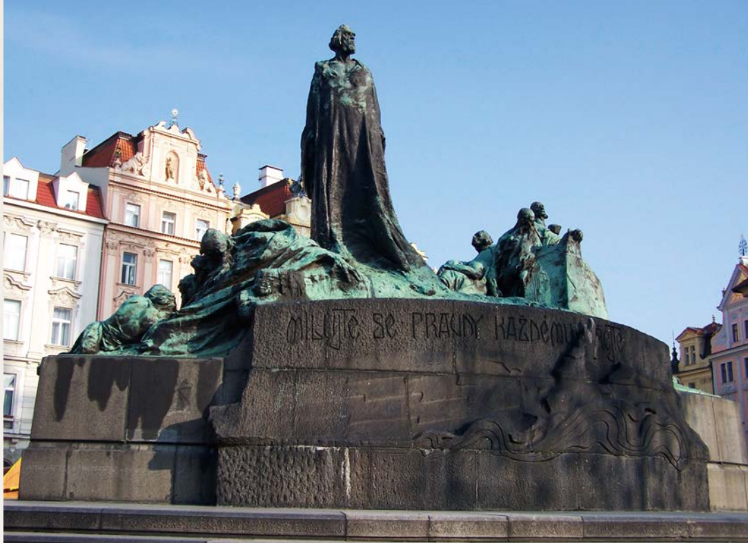
捷克布拉格廣場的胡司像。現今廣場四周是市集，讓遊人在自由的氣氛下歡聚，但昔日胡司卻是要面對教廷的壓力，最後以身殉道。