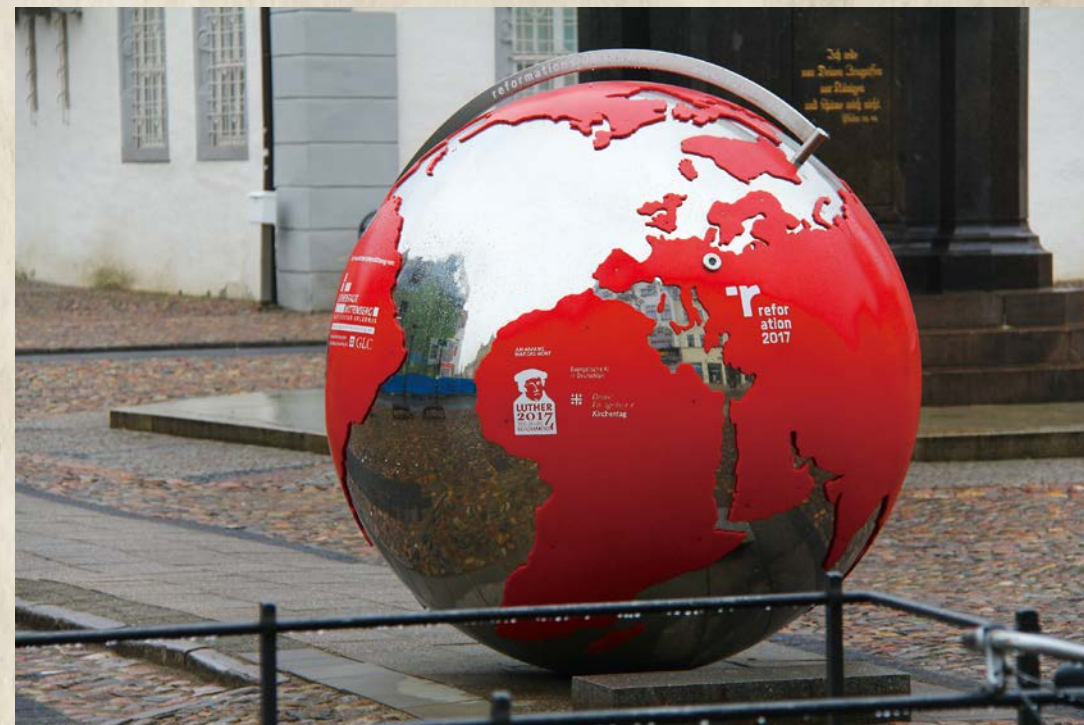
2017 年是紀念路德教會改革五百周年，在德國各地都有慶祝和紀念活動。

從 1483 至 1546 年，不僅是路德一生的時間，那也是世界改變的時代，從中世紀邁向近現代。任何時代的境況，都與所繼承的歷史有關，而那時代也踏出了讓下一代繼承的足跡。故此，就從路德之前的時代，開始本書將會敘述的這個故事。