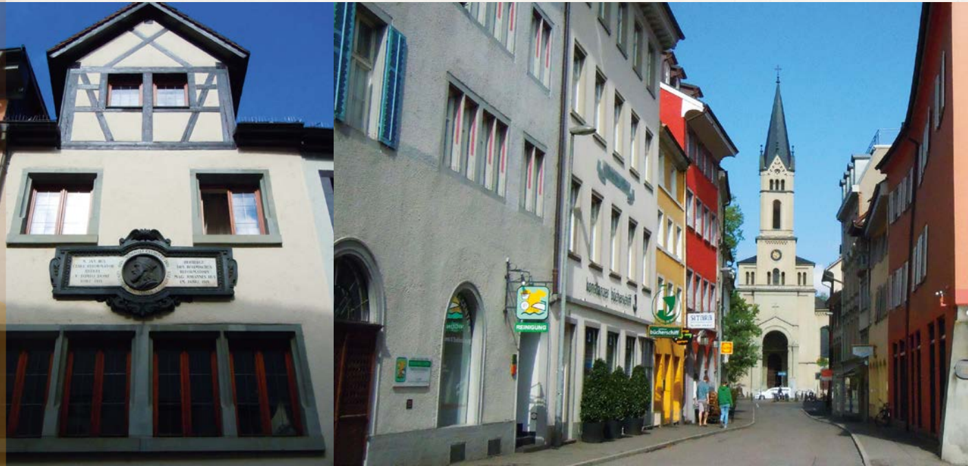
胡司前往 1414 年康斯坦斯會議時留居之地，最後被捕而被判火刑。

1999 年 12 月 17 日，教宗若望保祿二世 (John Paul II, 1920~2005) 為天主教將胡司燒死作出道歉，平反了五百多年前的錯判。