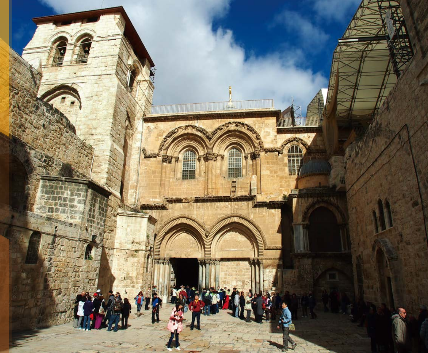
在耶路撒冷的聖墓教堂，紀念耶穌受難和埋葬之地。這教堂是由皇帝君士坦丁的母親海倫娜建於 335 年，代表羅馬帝國對基督教的信奉。